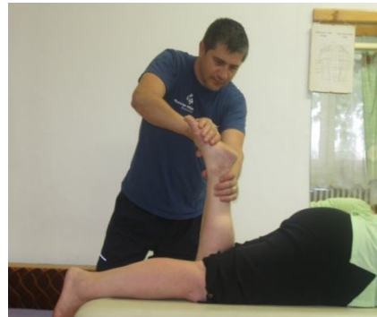
Fig. Nr. 7. Izometria alternantă – T1