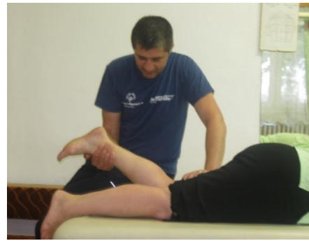
Fig. Nr. 5. Con tracția izometrică (CIS) – T3