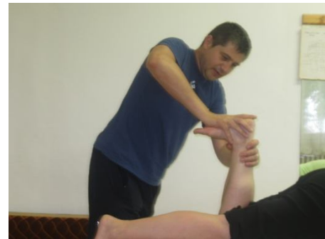
Fig. Nr. 3. Relaxare opunere – T1

3. Contractia izometrică în zona scurtată (CIS) – pentru mișcările de flexie și extensie a genunchiului.